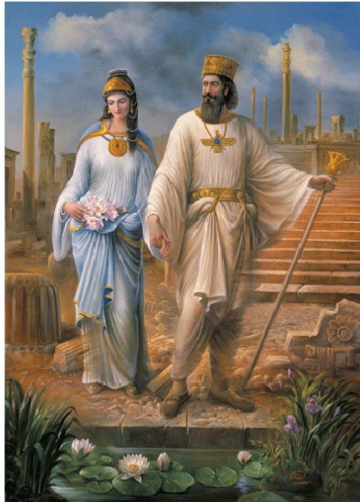
پاینده و جاوید ایران